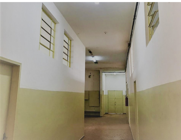
Pintura interna dos vestiários e salas do CSU (Centro Social Urbano) II

Confira as fotos em: https://is.gd/L5n089