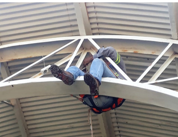
Instalação do Repelente Eletrônico na Piscina Municipal