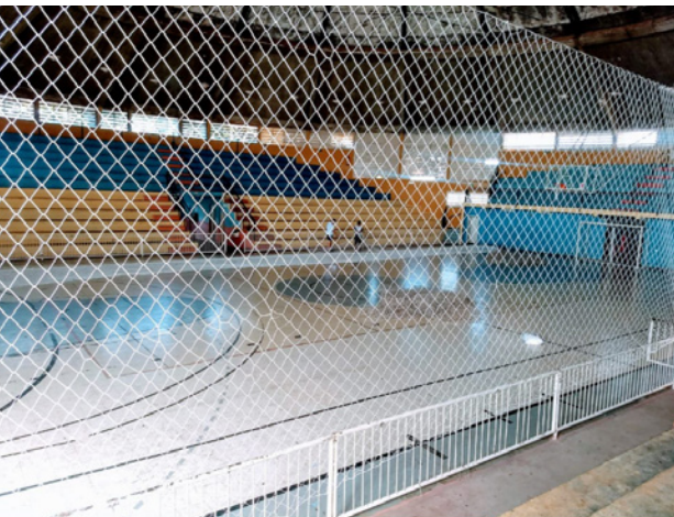
Redes de proteção no Ginásio Kim Negrão