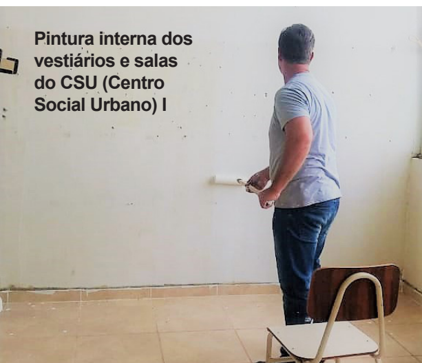
Pintura interna dos vestiários e salas do CSU (Centro Social Urbano) I