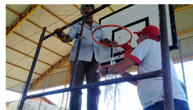
Instalação de tabelas e aros de basquete na quadra do Bairro Alto