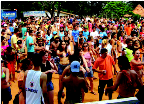
Carnaval no Camping contará com trio elétrico para os 5 dias de carnaval

A Prefeitura Municipal da Estância Turística de Avaré, através da Secretaria Municipal de Cultura e Lazer, está organizando o carnaval de rua da cidade.