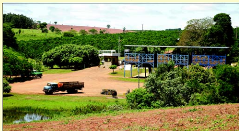
Plantação de Laranja