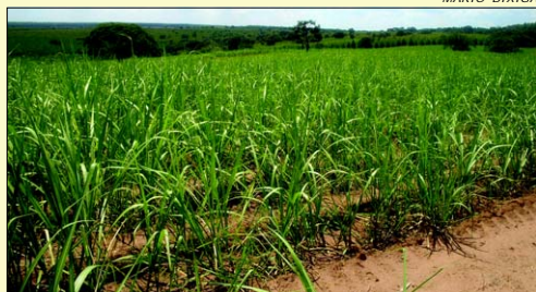
Plantação de cana-de-açúcar