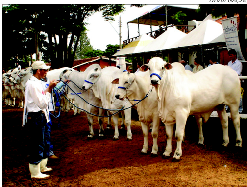
Alta performance e seleção genética do gado que participa dos leilões da Emapa é um dos diferenciais da exposição

O presidente do Núcleo Nelore Avaré, destacou que a alta performance e seleção genética do gado que participa dos leilões da Emapa é um dos diferenciais da exposição e fator preponderante para que criadores de renome e investidores de todo o País marquem presença no tartersal de Avaré.