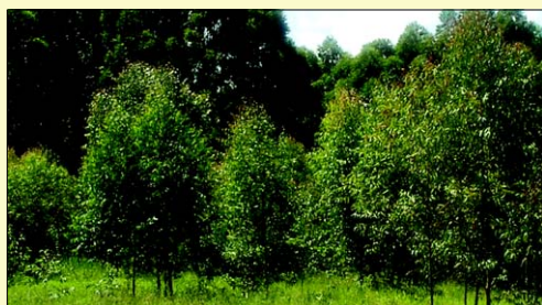
Plantação de Eucalipto

Avaré vem se tornando um importante pólo do agronegócio. Recentemente já iniciaram os trabalhos para a implantação de uma usina de álcool e açúcar em Avaré. O plantio da cana já começou e em breve deverá iniciar o funcionamento da usina. Avaré também vem