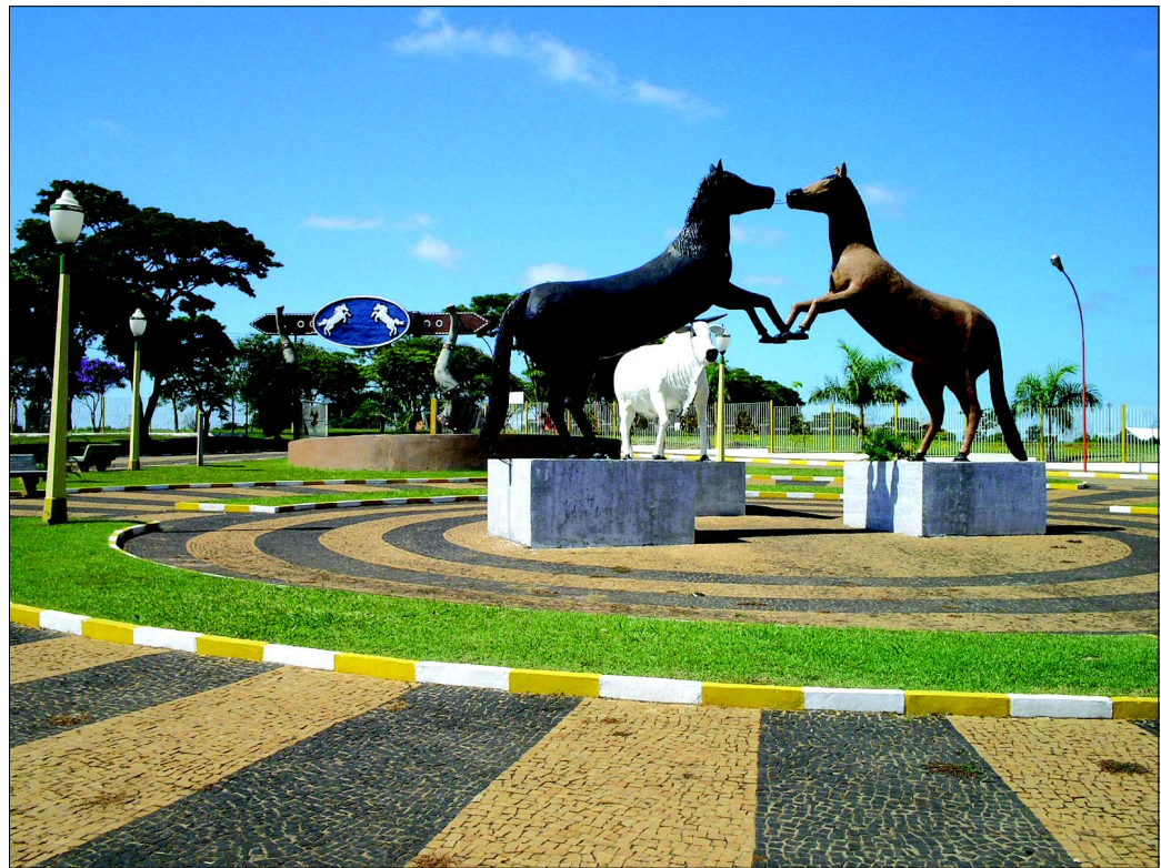
Serão dois turnos da feira que contará com 8 remates de animais das raças Brahman, Nelore e Simental

O presidente do Núcleo Nelore Avaré, destacou que a alta performance e seleção genética do gado que participa dos leilões da Emapa é um dos diferenciais da exposição e fator preponderante para que criadores de renome e investidores de todo o País marquem presença no tartersal de Avaré. Página 7.