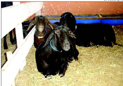
A Feira também contará com o julgamento de diversas raças de ovinos

De acordo com a ASPACO - Associação Paulista de Criadores de Ovinos, os animais que seguem para as pistas na 42ª Emapa somarão pontos para o calendário oficial de julgamentos de 2007. No total, 9 raças participam da Ex-