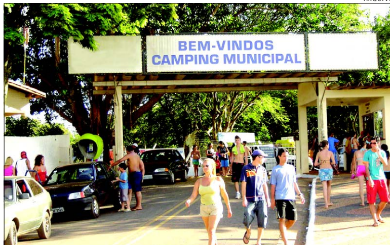
Carnaval no Camping contará com trio elétrico para os 5 dias de carnaval

Já no Camping Municipal com apoio da Secretaria de Turismo, o carnaval começou ontem (dia 16). Até terça-feira os foliões poderão contar com trio elétrico que agitará a partir das 10h00 até as 23h00.