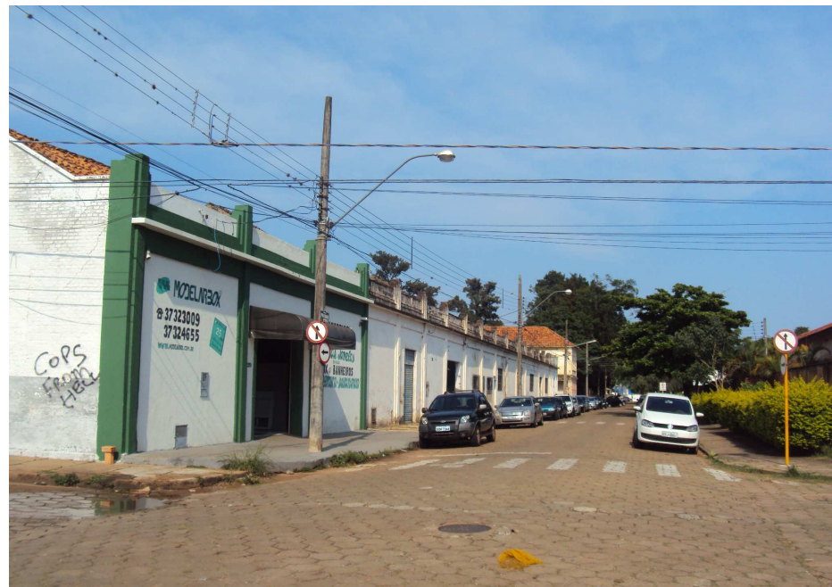
Rua Paraná em 1934, no Ciclo do Ouro Branco, e na atualidade.