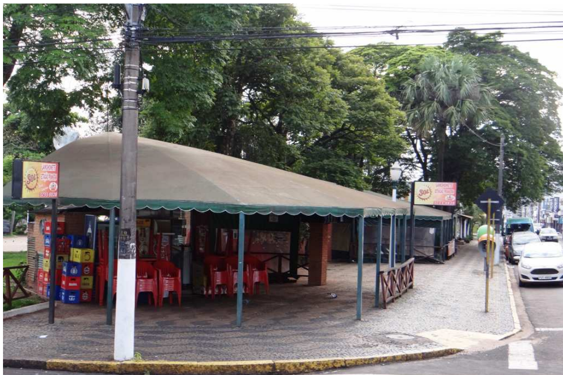
Reforma prevê melhor infraestrutura na praça central da cidade

"Com esse investimento, a ideia é valorizar espaços de convivência social da comunidade e manter acolhedores locais públicos na Estância Turística de Avaré", afirmam os dirigentes do setor.