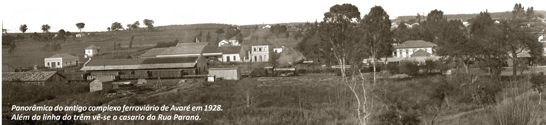
Panorâmica do antigo complexo ferroviário de Avaré em 1928. Além da linha do trem vê-se o casario da Rua Paraná.

Hoje, a via é o endereço da Casa do Advogado e da Escola Municipal Anna Novas de Carvalho, estando situada nas imediações das praças do Fórum e da velha estação ferroviária, ambientes de grande fluxo de pessoas.