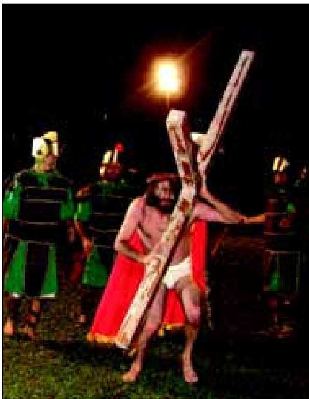
Jesus sofre o sacrifício durante a Via Sacra