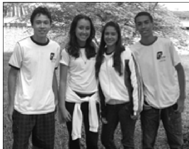
Alunos da ETEC responsáveis pelo "A Hora do Planeta" em Avaré

"Ficamos satisfeitos com a adesão de Avaré ao projeto e esperamos que no ano que vem a participação atinja toda a população, pois temos certeza que muita gente ainda não conhece o projeto 'A Hora do Planeta'", disseram os alunos, que registraram por inter-