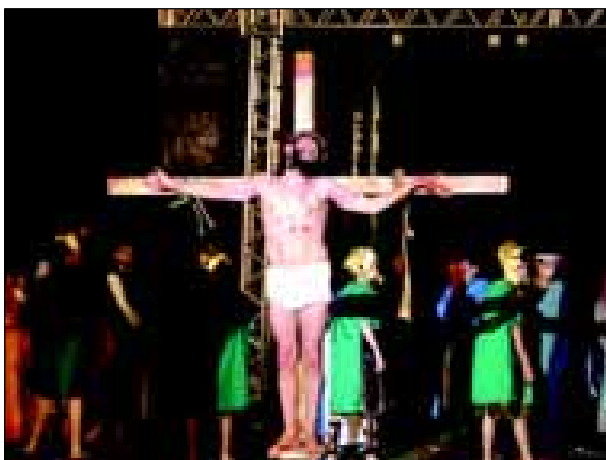
Crucificação de Jesus

Oliveiras, o julgamento, a Via Sacra até a chegada do Calvário, onde foi crucificado e morto.