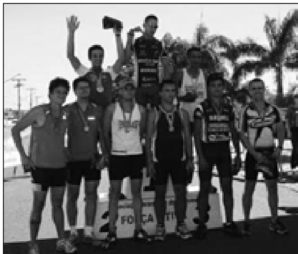
Os vencedores da edição de 2009, também organizada na Donguinha Mercadante

As inscrições podem ser feitas no local da pro-