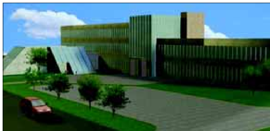
MAQUETE DE COMO SERÁ O O NOVO PRÉDIO DO PODER JUDICIÁRIO

possibilitará geração de empregos diretos e indiretos.