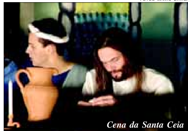
Cena da Santa Ceia

No final, o ator que interpretou Jesus, mostrou o momento em que Jesus venceu a morte e ressuscitou, como havia prometido. O espetáculo ficou a cargo da Secretaria Municipal da Cultura e Lazer.