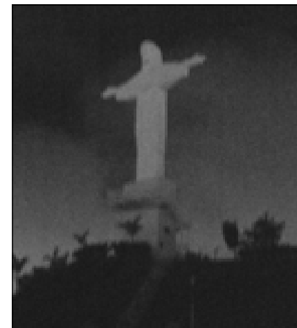
Cristo Redentor permaneceu com as luzes apagadas por uma hora

médio de fotos o "apagão" ocorrido na Praça da Paz e no Cristo Redentor entre às 20h00 e 21h30 do último dia 27.