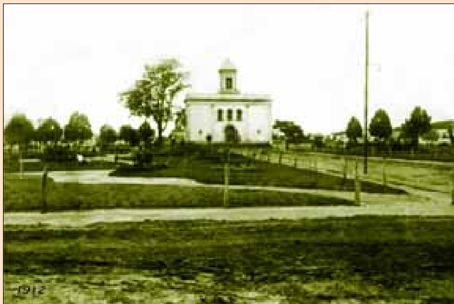
Velha Matriz de Avaré em 1912: igreja era o centro da vida local

No caso de Avaré, uma capela votiva teve