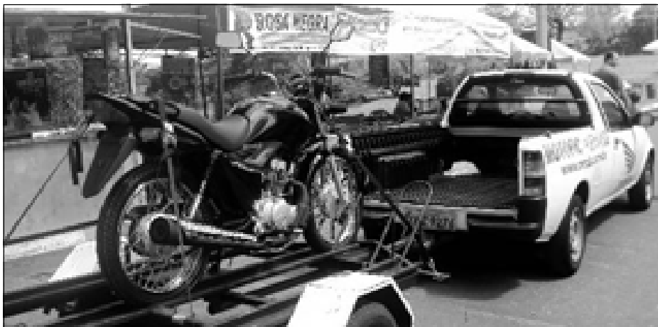
Uma moto será sorteada entre os participantes