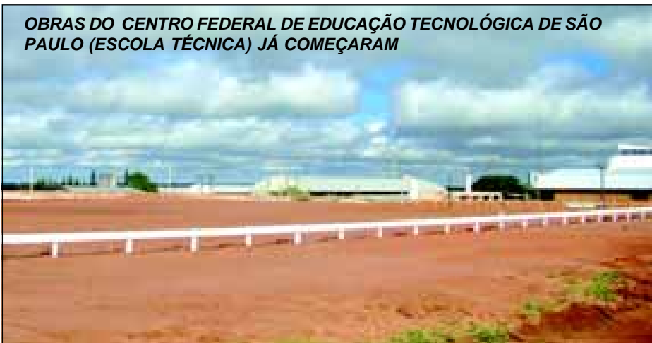
OBRAS DO CENTRO FEDERAL DE EDUCAÇÃO TECNOLÓGICA DE SÃO PAULO (ESCOLA TÉCNICA) JÁ COMEÇARAM

As obras do Centro Federal de Educação Tecnológica de São Paulo – CEFET -, também chamada de Escola Técnica Federal, já tiveram início. De acordo com a Secretaria de Obras, serão investidos R$ 5,8 milhões e, numa segunda etapa, que finalizará a obra, serão investidos mais R$ 4 milhões, num total de 29.650,00 metros