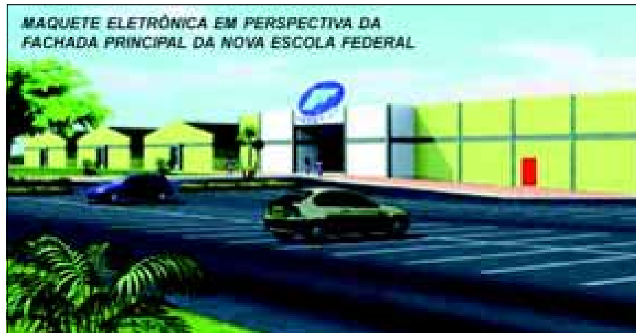
MAQUETE ELETRÔNICA EM PERSPECTIVA DA FACHADA PRINCIPAL DA NOVA ESCOLA FEDERAL

ses dados, o ministério avaliou os resultados do Exame Nacional do Ensino Médio (Enem), do Exame Nacional de Desempenho de Estudantes (Enade) e das Olimpíadas de Matemática. Neste último caso, em 2006, 28 alunos de escolas da rede estavam entre os 100 que ganharam medalhas de ouro.