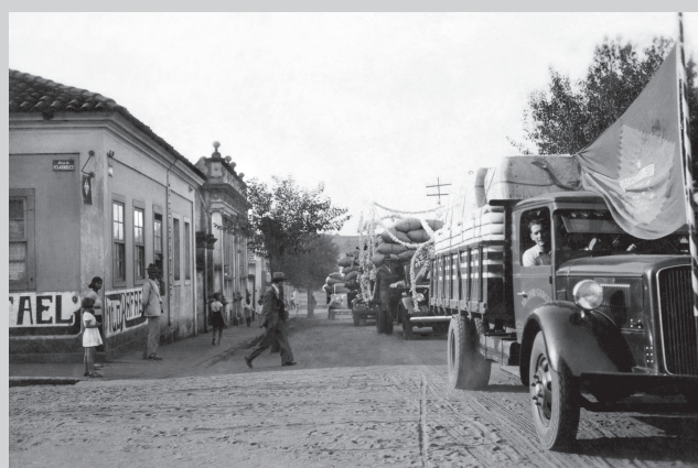
Desfile da Festa do Algodão, 1939.