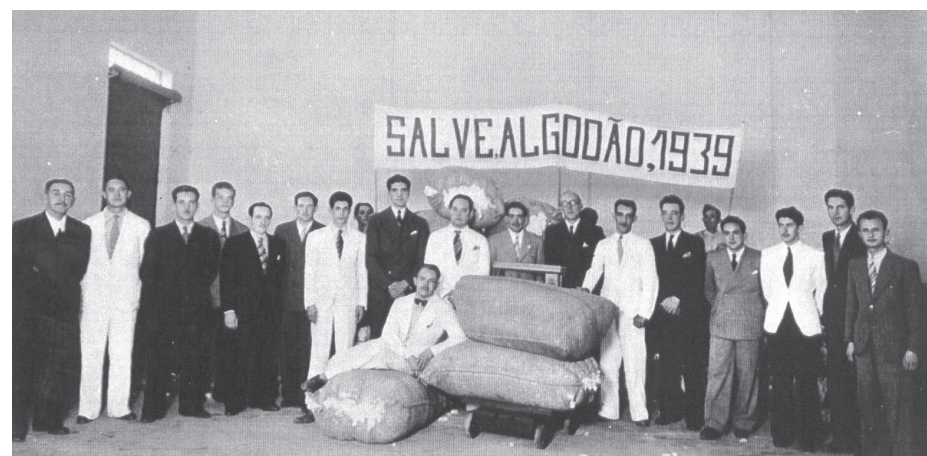
Prefeito e cotonicultores festejando colheitas recordes.