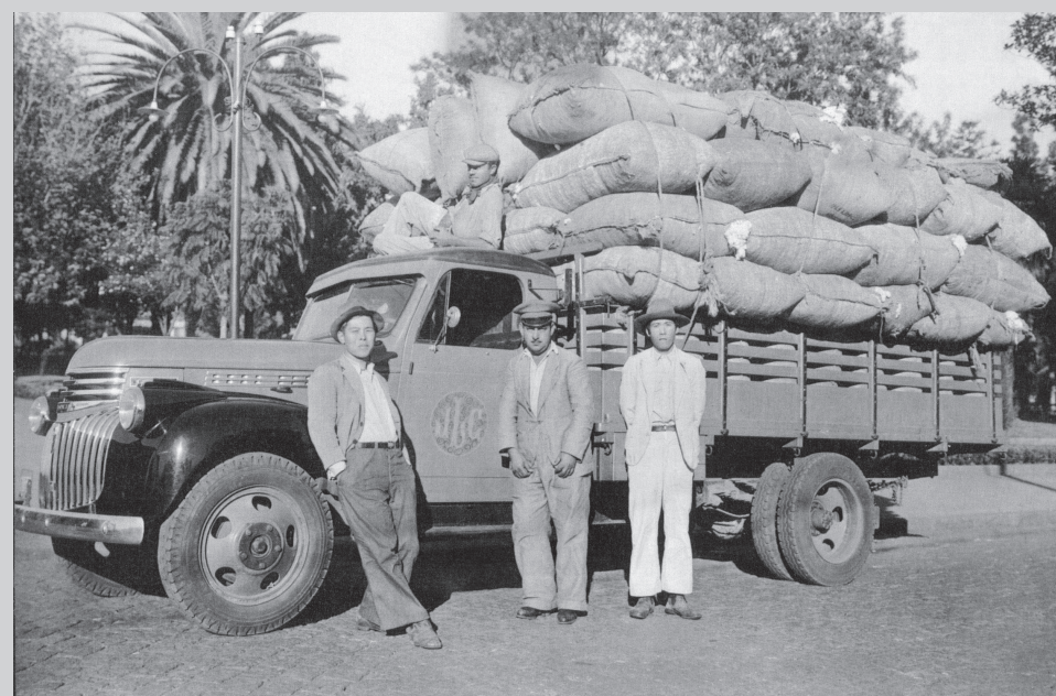
Caminhão com sacas de algodão: orientais eram arrendatários.

Outros fatores comprometeram a cotonicultura: anos de condições climáticas desfavoráveis ao algodoeiro e sua alarmante queda de produtividade, bem como a os-