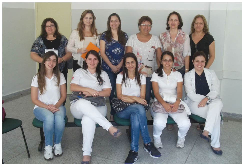
As equipes da Saúde e da Educação promovem a semana "Saúde na Escola"

A iniciativa foi possibilitada, em Avaré, pela união das pastas da Saúde e da Educação