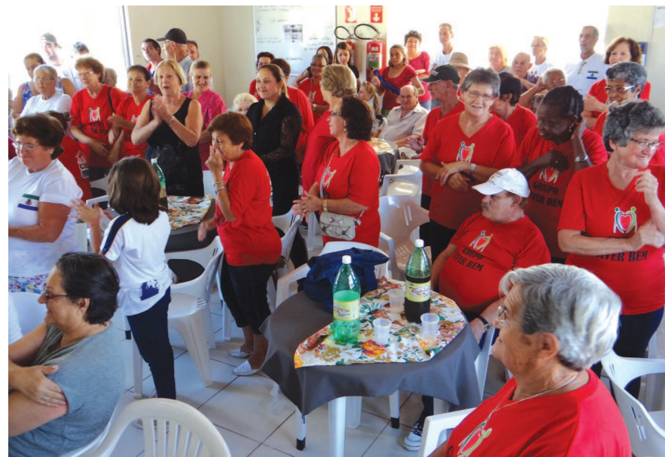
O almoço de Páscoa reuniu moradores da Vila Dignidade e assistidos do CRAS II

seus funcionários para ajudar a fazer o almoço, e do Fundo Social de Solidariedade, que doou as toalhas utilizadas nas mesas da fes-