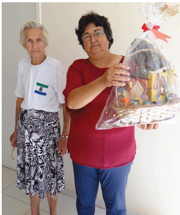
No final, um kit de Páscoa foi sorteado entre os participantes da iniciativa

O evento contou com a participação de mais de 80 pessoas, entre elas representantes do Fundo Social de Solidariedade do CRAS II, da Vila Dignidade e da Cozinha Piloto. O almoço e a aquisição dos ovos de páscoa foram viabilizados por meio de parceria entre o CRAS II e a Vila Dignidade, que recebem, res-