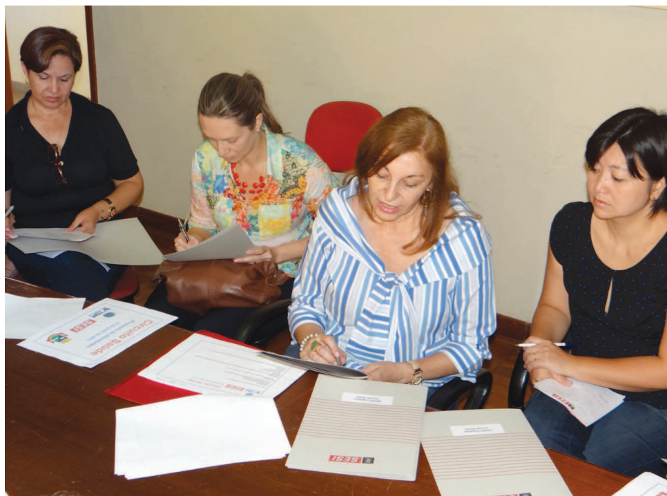
Integrantes do SESI discutiram ação social que acontecerá no município