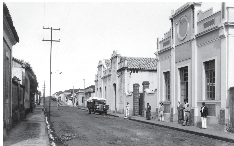
Posto de Expurgo na Rua Ceará.

De fato, então com pouco mais de 30 mil habitantes, Avaré alcançou safras expressivas em anos seguidos. Isso melhorou muito os indicadores de sua economia, gerando empregos, ativan-