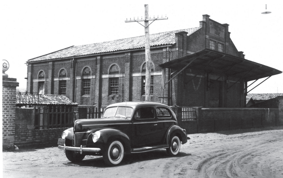
Cooperativa de Japoneses: auge da cotonicultura.

Relatos do engenheiro agrônomo Bastílio Ovídio Tardivo, respeitado técnico do setor agrícola, comprovam que, em meados dos anos 1930, Avaré era o maior produtor estadual de algodão, cujas lavouras predominavam nas terras de Arandu e do Bairro da Usina.