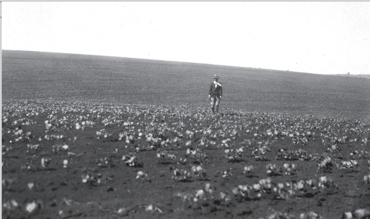
1934: algodoeiros predominavam nas terras de Avaré.

“Grandes fortunas foram feitas e desfeitas numa rapidez como nunca se viu. Tínhamos então uma agroindústria que ocupava não só nossa mão-de-obra chegando a formar uma mão-de-obra industrial”, observou.