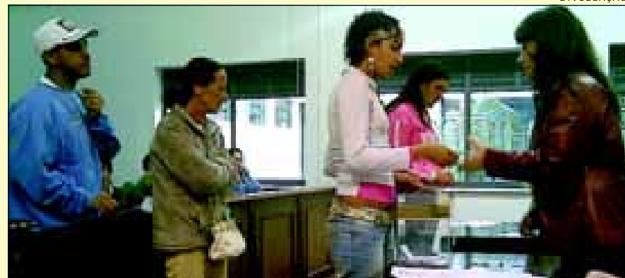
Funcionária da CDHU entregando os endereços das residências aos mutuários sorteados

A Secretaria Municipal de Habitação, juntamente com a CDHU, realizou ontem, dia 15, o sorteio dos endereços das 75 Unidades Habitacionais do Conjunto Habitacional Cid Ferreira no bairro Duílio Gambini, para elaboração dos documentos. A entrega das chaves e assinaturas do contrato devem ocorrer em breve.