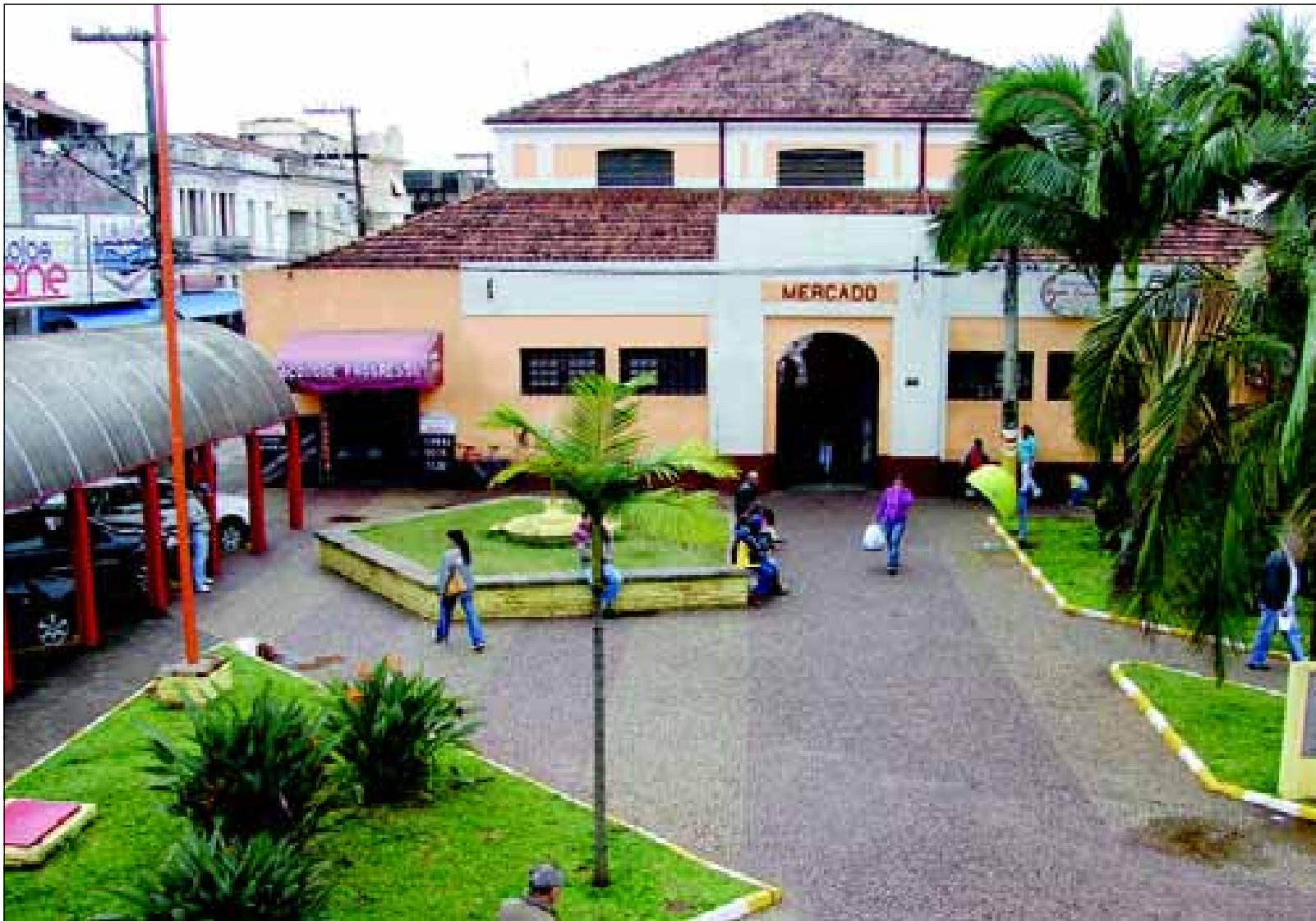
Mercado Municipal: 100 anos de história

Durante as comemorações será lançado oficialmente o Selo Comemorativo com a apresentação aos consumidores das sacolas ecológicas especialmente confeccionadas para marcar a data e o lançamento do Cartão Postal do Centenário de sua implantação.