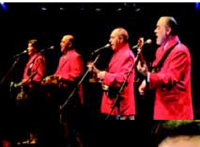
Dia 13/09 2ª Eliminatória Nacional: Show com Demônios da Garoa