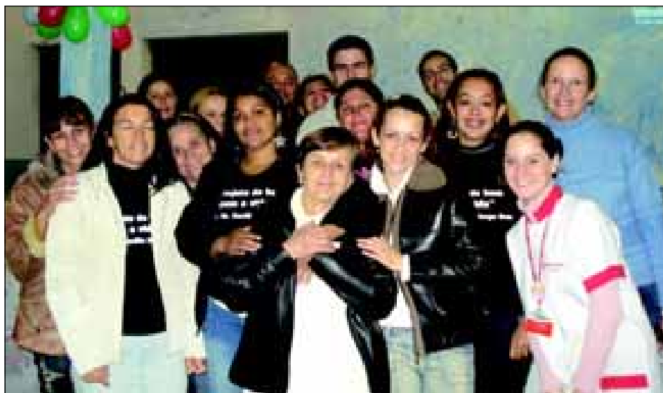
Equipe do ESF I, responsável pela festa do Dia dos Pais