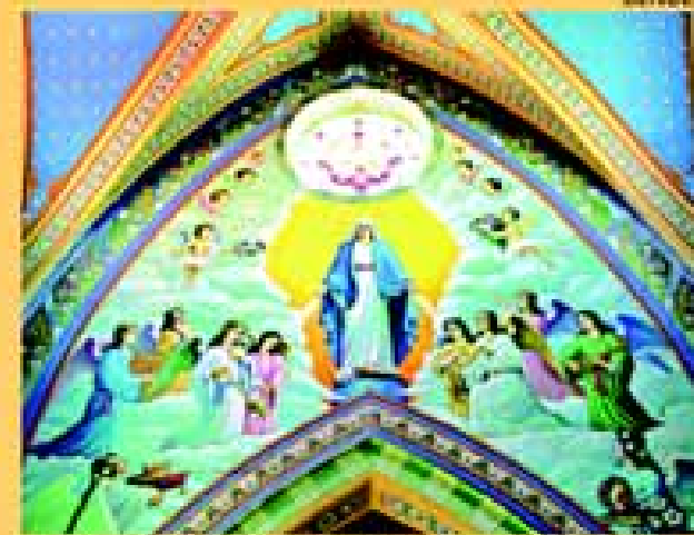
Nossa Sra. das Graças, afresco em capela lateral.

Em Avaré, por exemplo, Pavlovic usou dos recursos aprendidos em Viena e da influência de Klimt para realizar sua maior obra. Com base no barroco, não deixou de empregar técnicas impressionistas para exprimir, no conjunto da obra, redenção e glória.