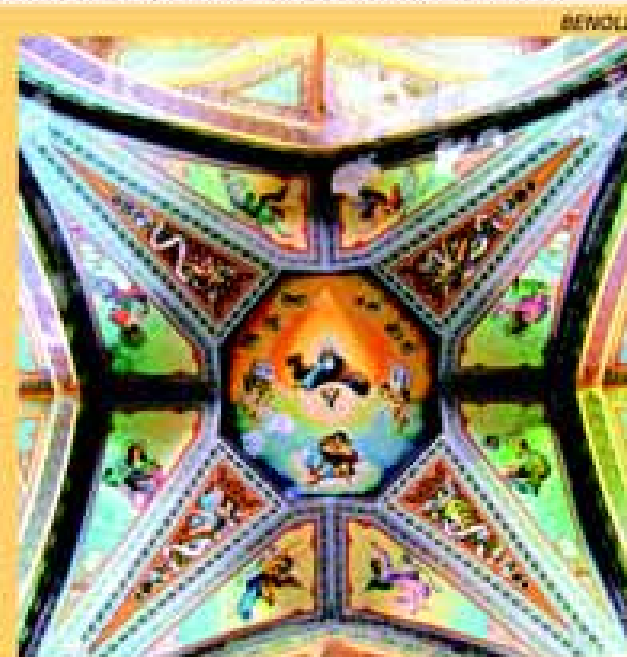
Pal Eterno: pintura sobre o teto do altar mor

Conheça mais sobre o assunto acessando as seguintes páginas virtuais: www.geocities.com/igreja-matriz-avare/nave.html e http://paulovic.zoqui.com/avare .