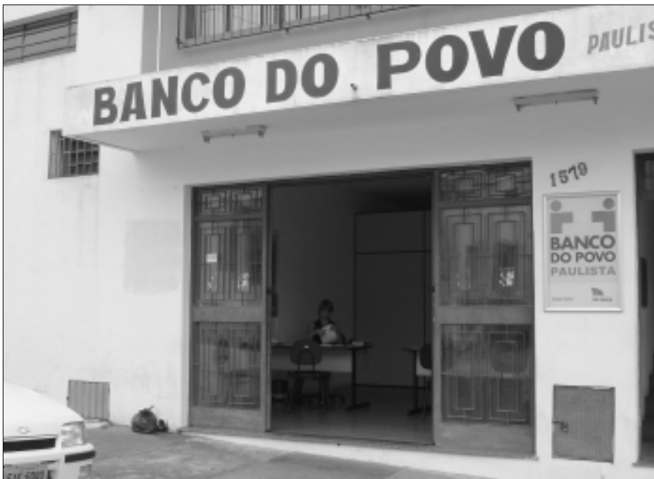
Agência do Banco do Povo de Avaré atende na Rua Maranhão, 1579