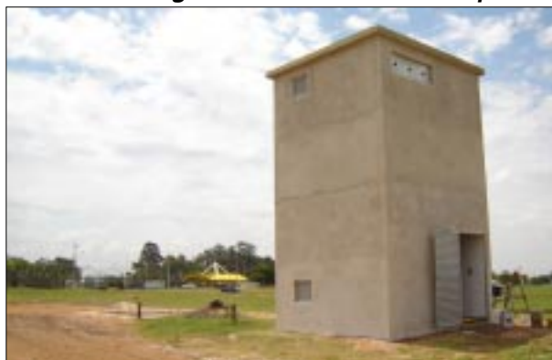
Cabine de energia foi construída para maior segurança