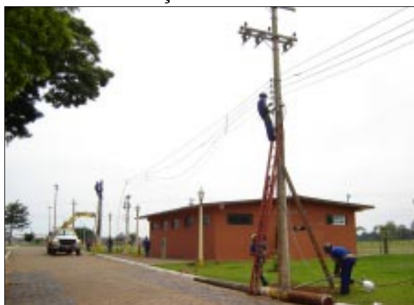
Rede de energia elétrica está sendo recuperada