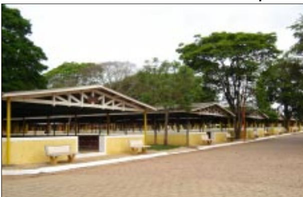
Nova pintura em diversos locais do parque