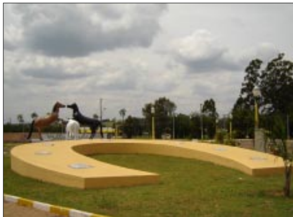
Praça do Criador está revitalizada