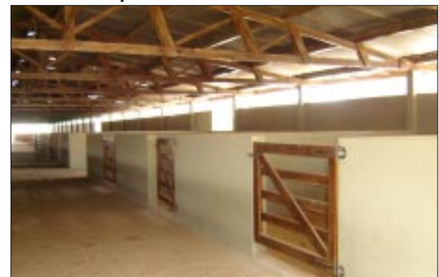
Local de exposição dos animais recebeu melhorias