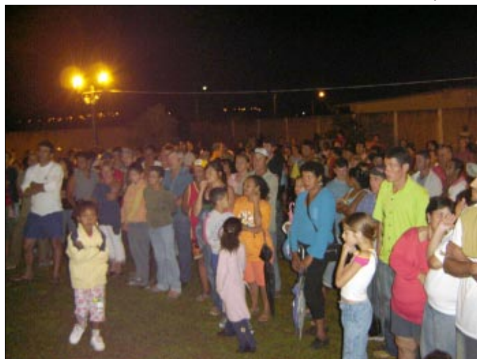
Reunião com moradores do Tropical e Paraíso