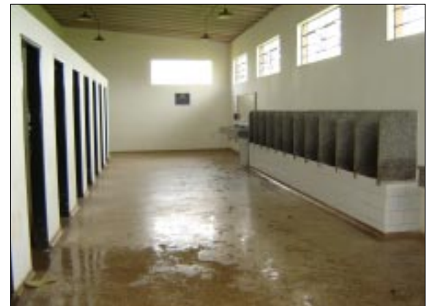
Banheiros foram reformados