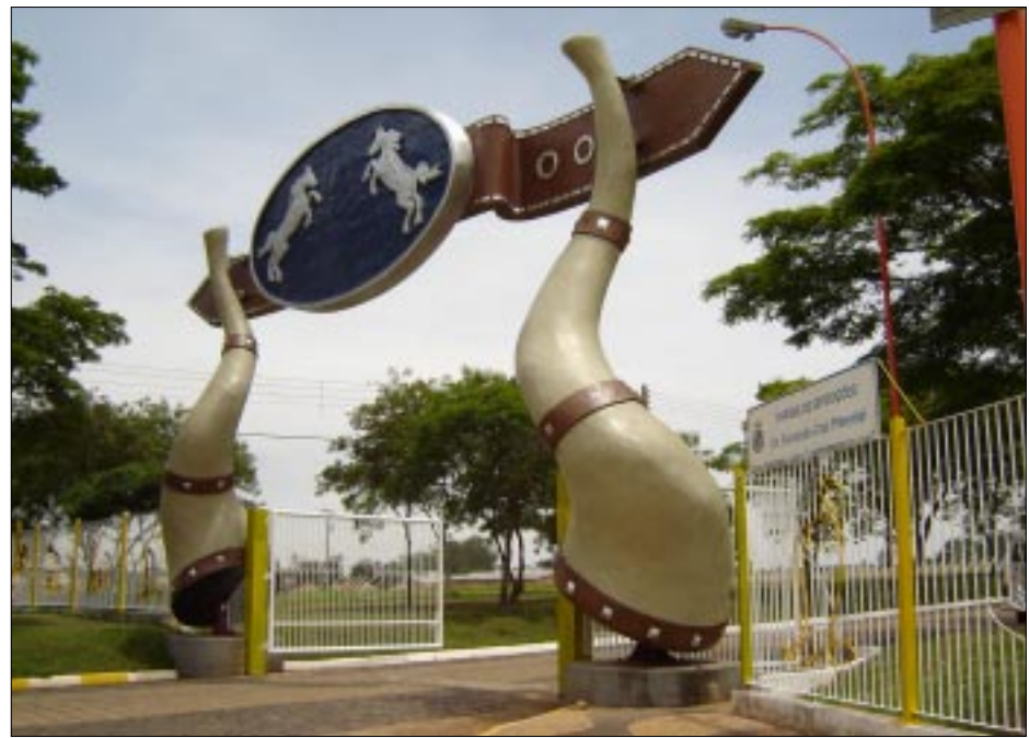
Portal de entrada recebeu nova pintura

A exposição ainda contará com Parque de Diversões, Bailão, e exposição de barracas de diversas empresas.