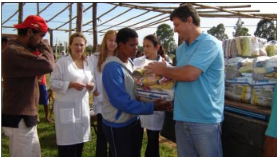
Foram doadas 131 cestas básicas arrecadadas pela Rádio Paulista

Além do atendimento preventivo o Programa Saúde da Família (PSF) também está fazendo trabalhos sociais. Na última terça-feira (dia 22/11) o PSF do bairro Jardim Paineiras de Avaré realizou a distribuição de cestas básicas para as famílias carentes do bairro.