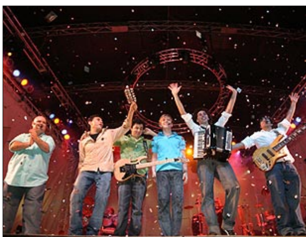
Grupo Tradição fará o show de abertura no dia 3 de dezembro

A expectativa é muito grande para a realização da 5ª edição da Festa Country, que acontecerá de 3 a 11 de dezembro no recinto da Emapa. A grade de shows, com grandes nomes da música popular e a série de eventos que estarão acontecendo durante os nove dias de evento, promete fazer da Festa Country um acontecimento inesquecível e com recorde de público.