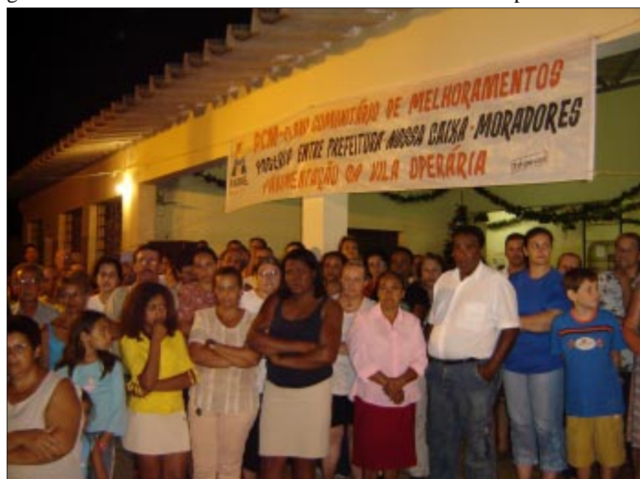
Reunião na Vila Operária

A próxima meta do Recreando do Jardim Paineiras é conseguir, através de uma parceria com a comunidade local, a cessão do Centro Comunitário do Bairro, onde seriam realizadas uma série de atividades como aulas de dança, capoeira, artesanato, além de orientação sexual para adolescentes.