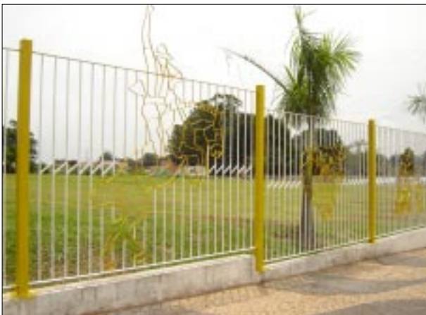
Gradil lateral está com novo visual