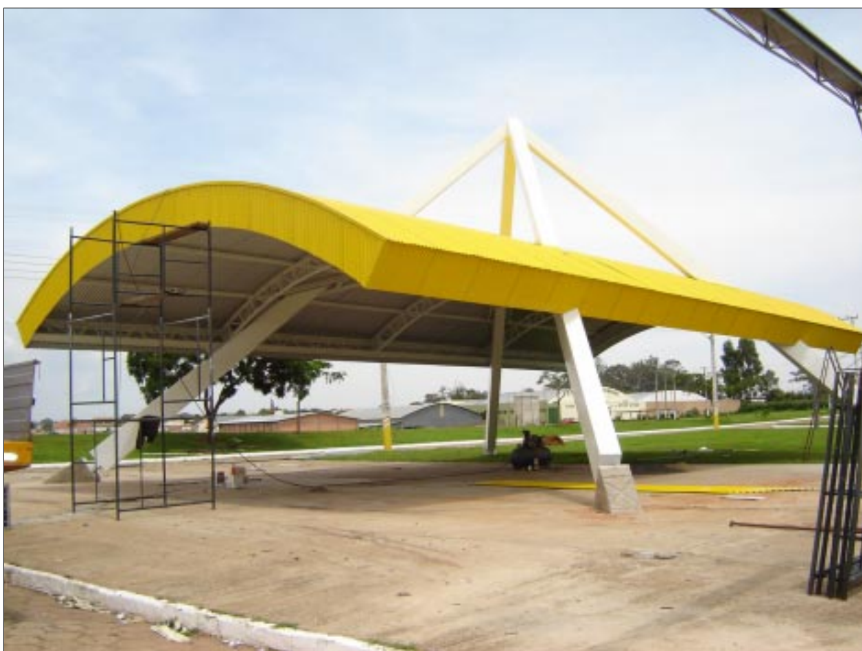
Melhorias está sendo realizadas no Parque de Exposições para receber os visitantes