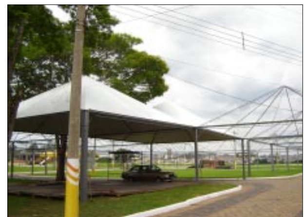
Principais ruas estão recebendo cobertura