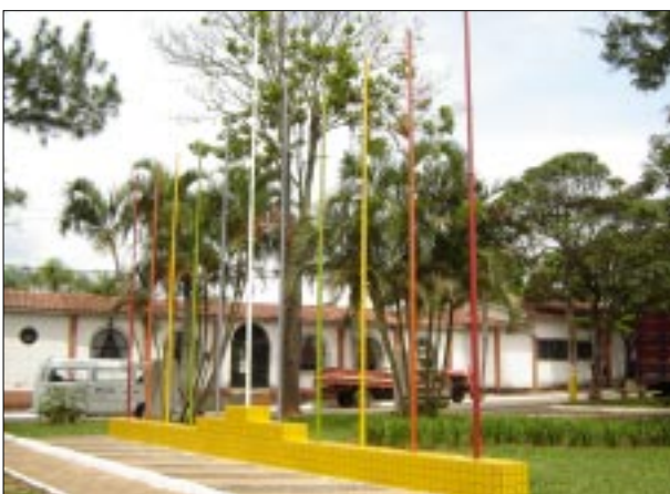
Mastros das bandeiras estão com nova pintura