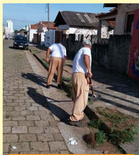
Rua Rio de Janeiro