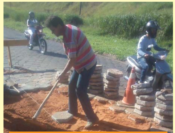
Rua Lineu Prestes