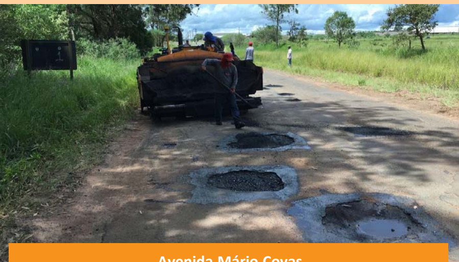
Avenida Mário Covas