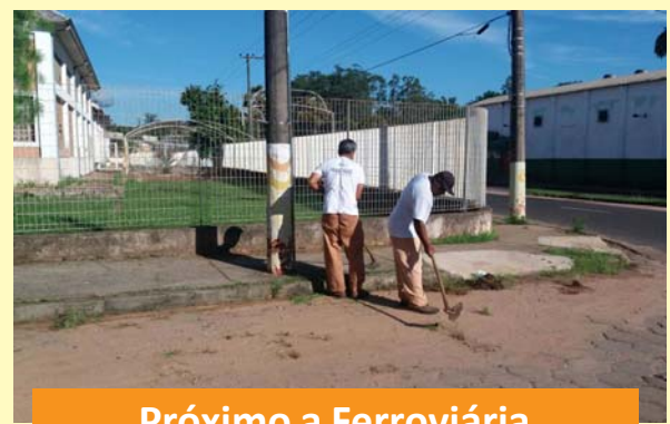
Próximo a Ferroviária