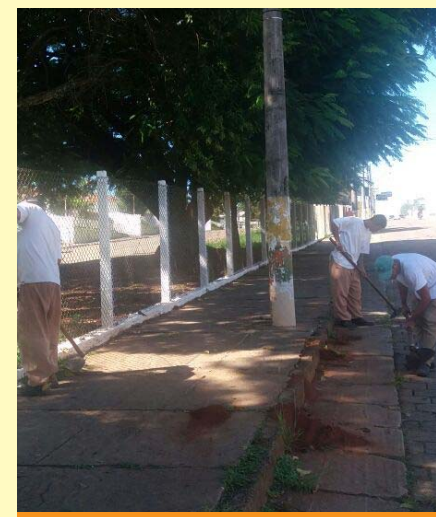
Próximo a Penitenciária