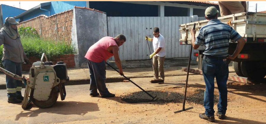
Avenida Santos Dumont, principal via de acesso aos bairros da Zona Sul