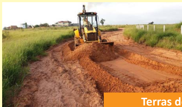
Terras de São José