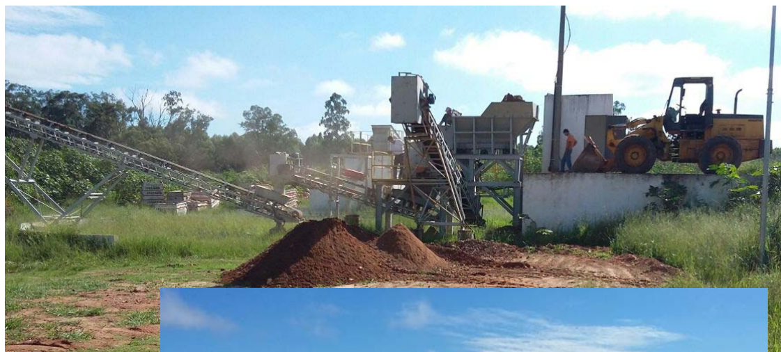
Os serviços de trituração de resíduos já está normalizado

As empresas de locação de caçambas já estão autorizadas a destinar os detritos sólidos provenientes das obras diretamente para usina, que se responsabiliza pelo processo de trituração e reciclagem.