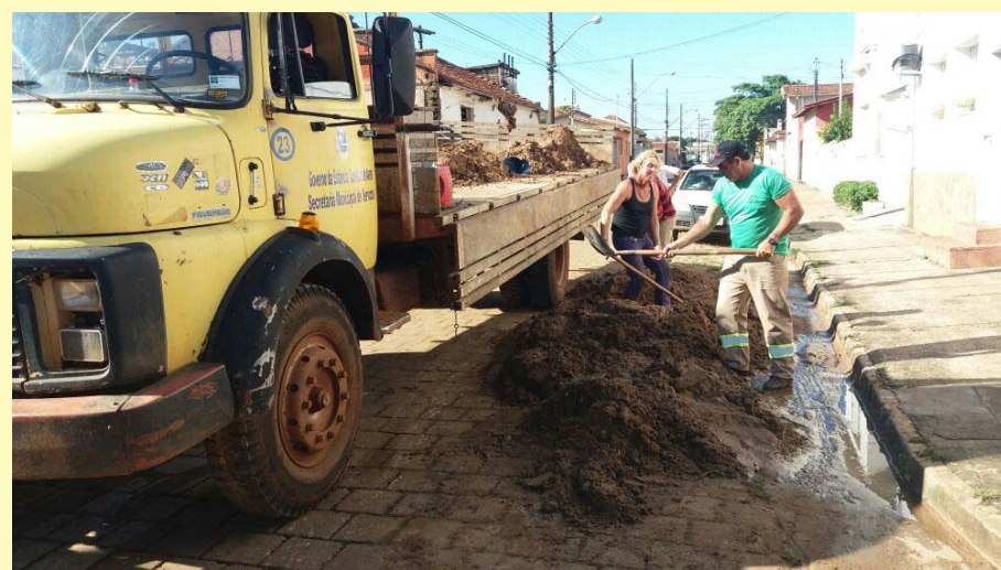
Limpeza na Rua Maranhão