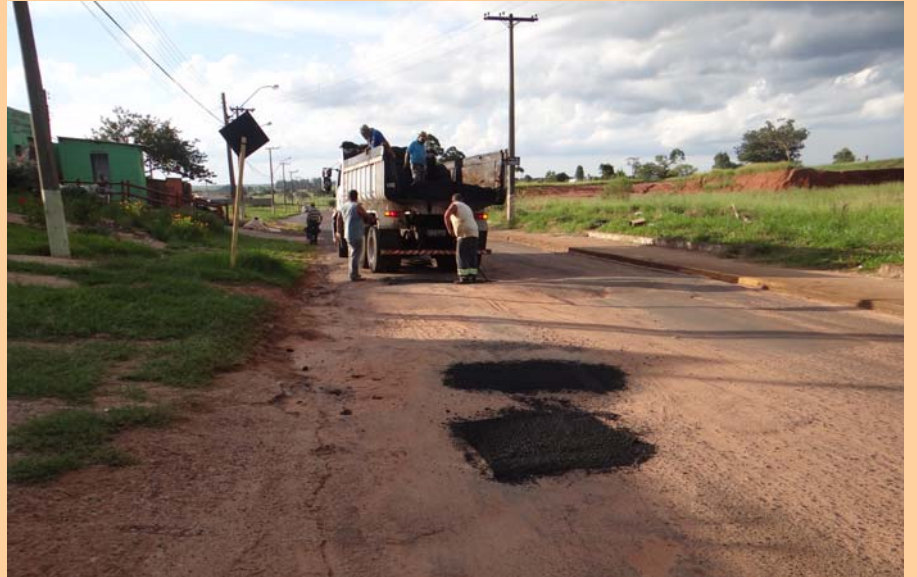
Avenida Manoel T. Sampaio, importante via de acesso aos bairros Jardim Santa Mônica, Presidencial, São Rogério e Duílio Gambini