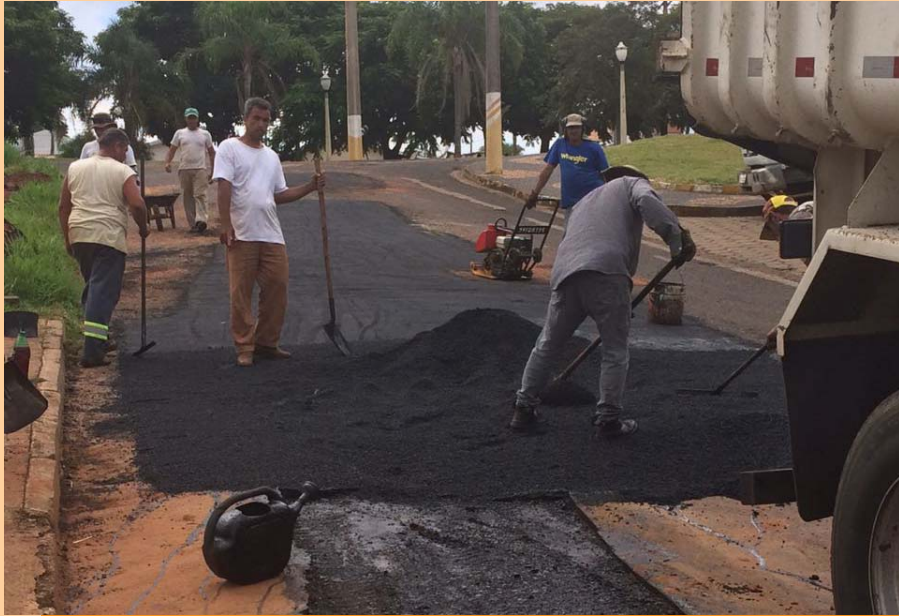
Rua Fernando de Moraes