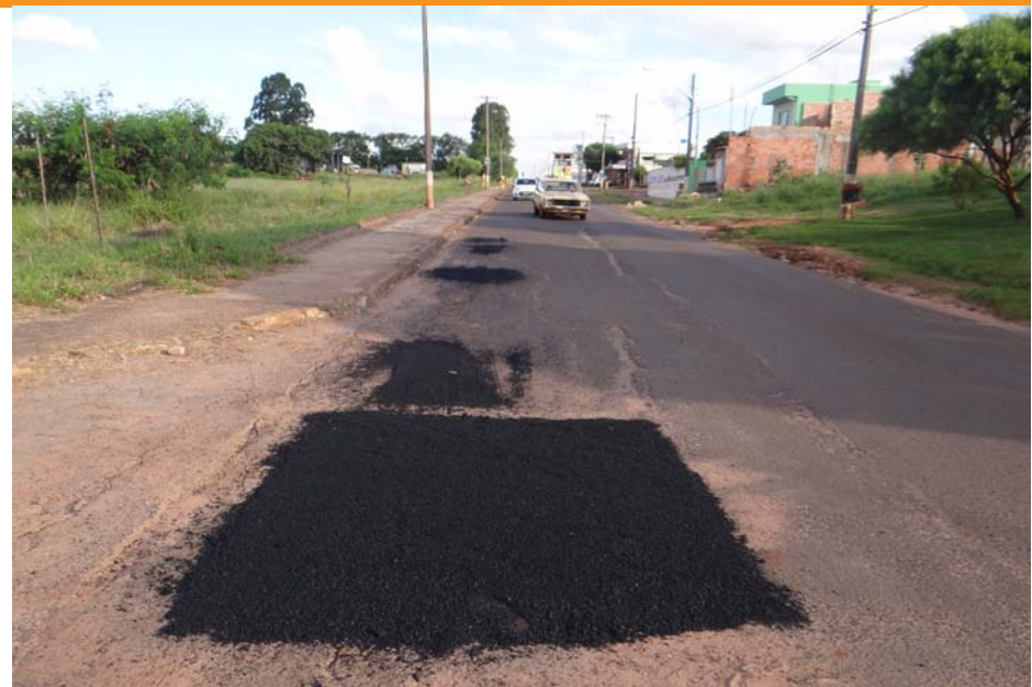
Rua Fernando de Moraes e Avenida Manoel Teixeira Sampaio receberam a Operação Tapa Buracos