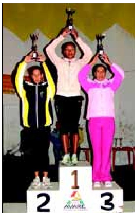
Premiação da categoria geral feminino