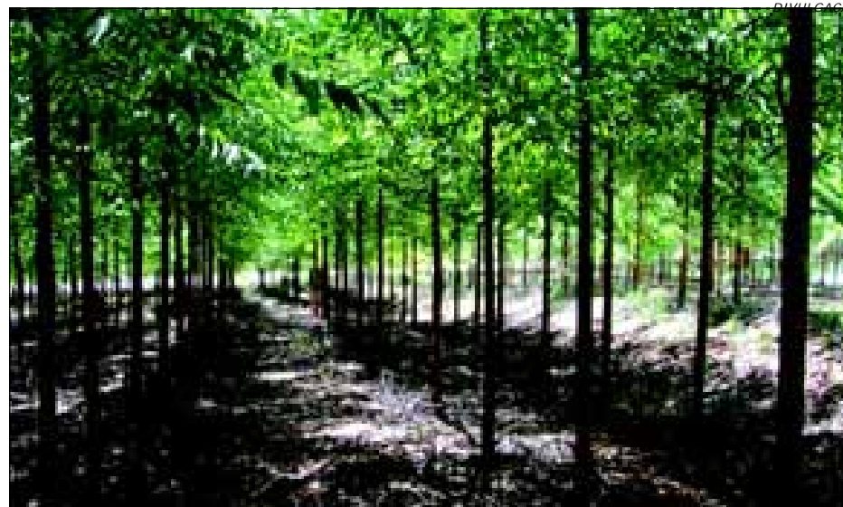
Eucalipto: área plantada deve aumentar nos próximos anos

Os dados preliminares do Levantamento das Unidades de Produção Agropecuária – LUPA, realizado pela equipe técnica do Escritório de Desenvolvimento Rural/EDR/CATI/Avaré, mostram que o agronegócio avareense movimentou uma renda bruta de R$ 150.234.131,84 em 2007 e, prova que, apesar do avanço do turismo, a agropecuária ainda é a base da economia na Estância Turística de Avaré.