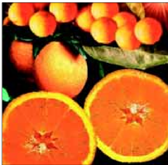
Cultivo da laranja: Avaré terá em pouco tempo um dos maiores parques citrícolas do Estado