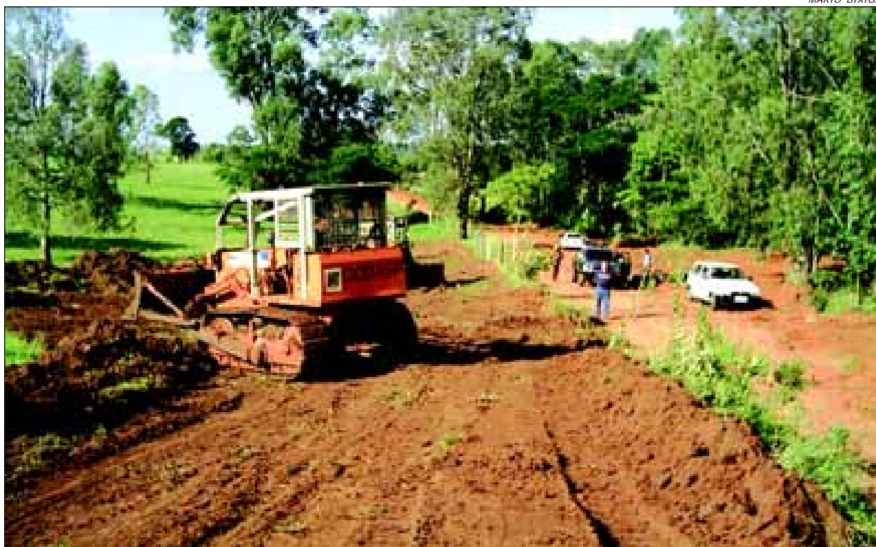
Máquinas da CODASP já estão fazendo a limpeza e suavização dos barrancos

serviço inicial de suavização, limpeza e corte de barrancos, mas que nos próximos dias mais máquinas (motoniveladora, retroescavadeira, rolo compactador, caminhões, etc) estarão trabalhando na área. A obra deve estar pronta dentro de 90 dias e é baseada na readequação do leito carroçável da estrada aliada à conservação do solo, evitando erosões. “Além da elevação e abaulamento do leito, vamos fazer bigodes (curvas de nível), terraceamentos, alargamento, lombadas e as demais estruturas para evitar o escoamento rápido das águas das chuvas. Se for necessário, vamos fazer a instalação de tubulação em