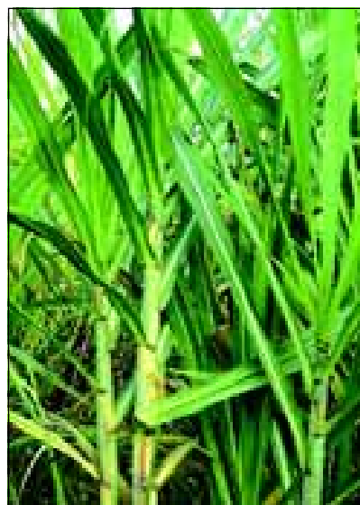
Cana-de-açúcar: tendência é aumentar área plantada na região