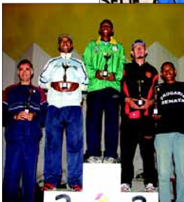
Premiação da categoria geral masculino