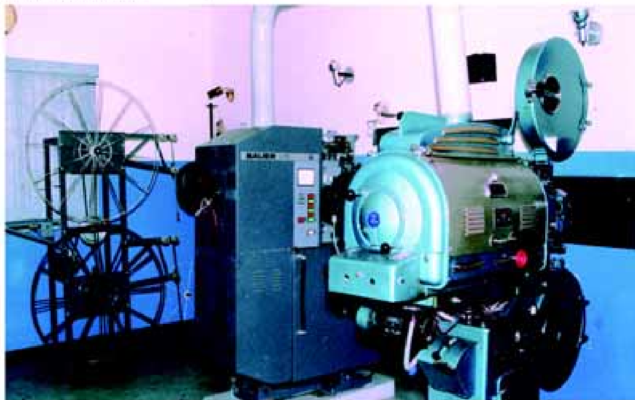
Projetores do cineclube integram o patrimônio municipal

to do conhecimento do cinema e de difusão de uma visão mais ampla e generosa da expressão audiovisual do que aquela com que Hollywood nivelava o imaginário mundial.