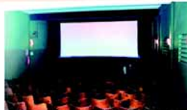
Sala do cineclube tem capacidade para 200 pessoas.

Ao manter a projeção semanal de filmes e a promoção freqüente de cursos, debates, ciclos e retrospectivas de cine-