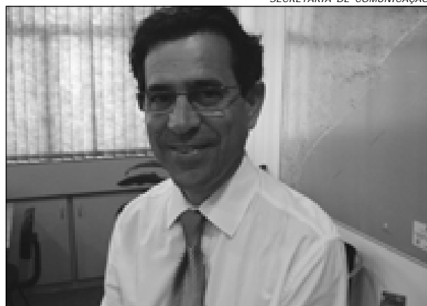
SECRETARIA DE COMUNICAÇÃO

Dentre as reivindicações, como a instalação de Estação de Monitoramento da Qualidade do Ar, Curso de Capacitação em Educação