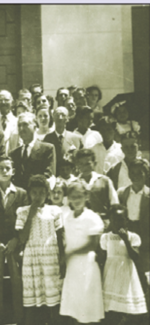
Grupo em festa cívica de 1952

modos e reproduzem a tendência vista em edifícios públicos concebidos por simpatizantes do nazi-fascismo.