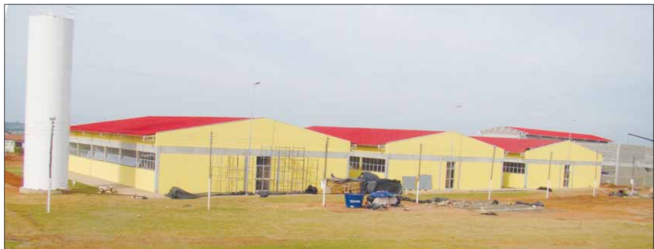
Instalações da Escola Técnica Federal

Para concorrer às vagas os candidatos deverão ter concluído o 1º ano do Ensino Médio (estar cursando o 2º ou 3º ano) ou concluído o Ensino Médio. As inscrições são feitas exclusivamente pelo site www.vestibularifsp.com.br e serão realizadas somente até às 15h00 do próximo dia