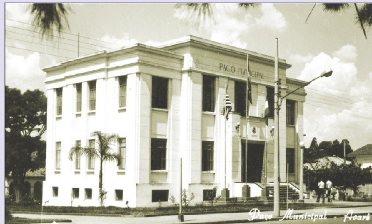
Vista do Paço Municipal em meados dos anos 70