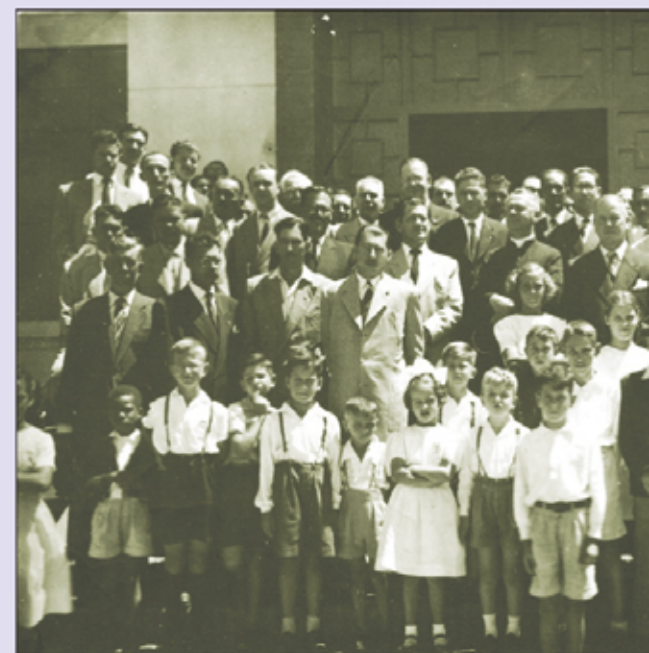
Autoridades e crianças em frente do Paço

O Paço Municipal teve sua construção principiada no fim da gestão do prefeito Diamantino Monteiro da Gama, em