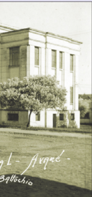
Paço Municipal, meados dos anos 50