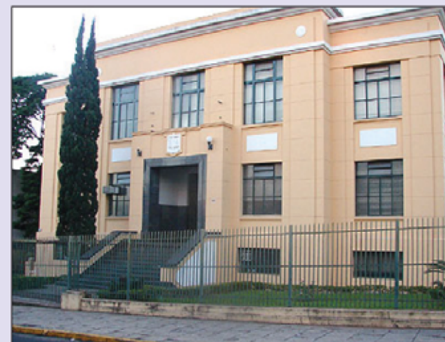
Antigo Fórum de Presidente Prudente, projeto idêntico ao do Paço de Avaré