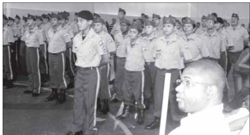
Alunos durante a formatura

Uma nova turma terá início em breve, e as vagas para o curso estarão abertas entre os dias 16 e 30 de novembro, para ambos os sexos, a partir dos 12 anos de idade e sem custo. As aulas são realizadas no salão de artes marciais da Guarda Mirim, localizado na Rua Ceará nº1507. Para