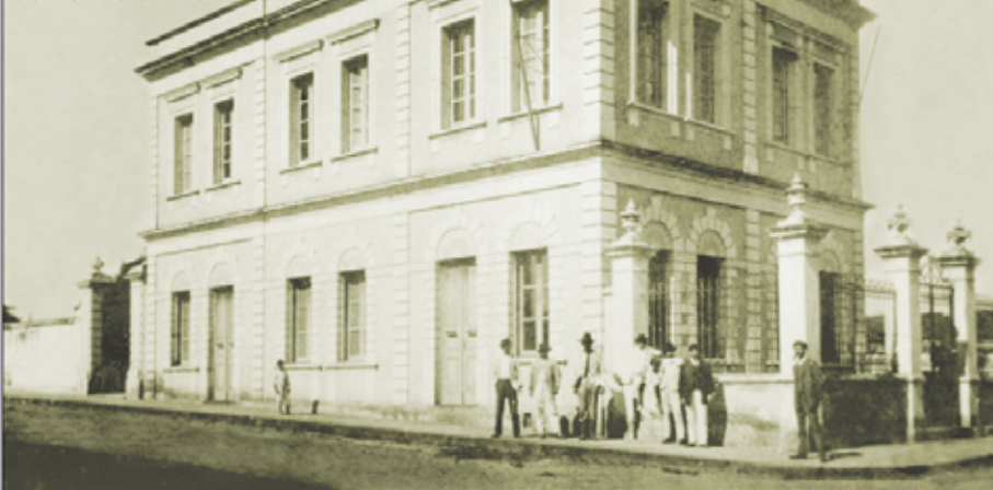
Prédio da Intendência de Avaré, construído em 1900 e demolido em 1947

Atualmente no local são mantidos os serviços do gabinete do prefeito e de sua Secretaria Executiva. Estão também instalados no mesmo prédio a Secretaria de Comunicação, a redação do Semanário Oficial, a Ouvidoria e os Departamentos de Gestão de Convênios, de Análise e Conferência, de Licitação e de Compras.