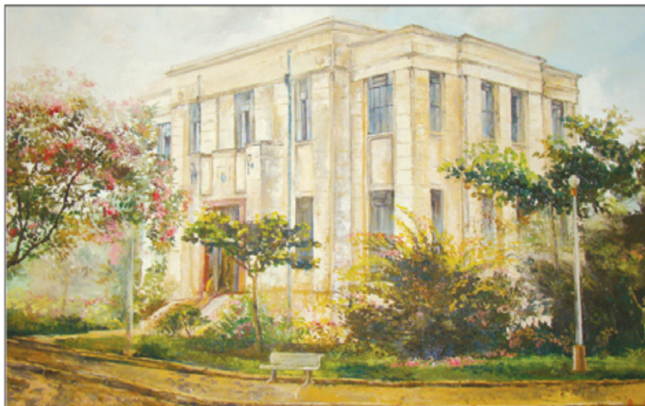
Óleo sobre tela de F. Tegani

“Trata-se, na verdade, de um belo e amplo edifício, dotado de acomodações espaçosas e confortáveis, satisfazendo plenamente ao fim a que foi destinado” – avalia outra nota da imprensa da época.