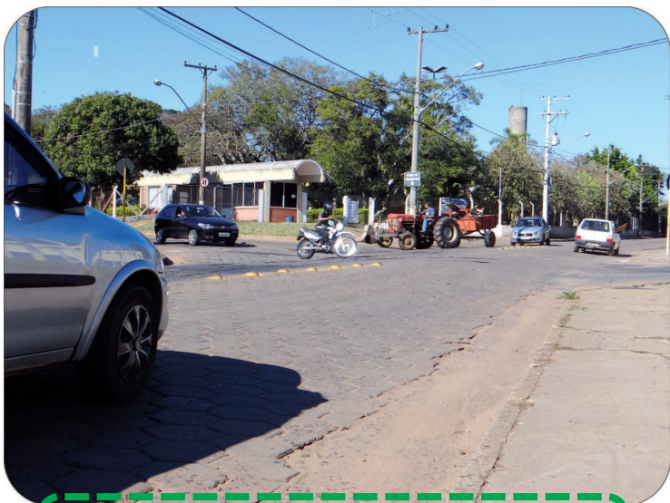
Esquina da Avenida Anápolis com Rua Jango Pires

Produtos novos vão melhorar a sinalização viária em vários trechos urbanos