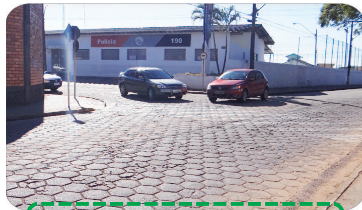
Rua Bahia com Rua Lineu Prestes

Além dos 18 semáforos a serem substituídos, três novos serão colocados nos seguintes locais: na esquina da Avenida Major Rangel com a Rua Piauí (próximo ao Poupatempo); no cruzamento da Rua Bahia com Lineu Prestes e no cruzamento da Avenida Anápolis com a Rua Jango Pires (próximo à Garagem Municipal).