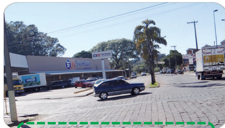
Cruzamento da Avenida Major Rangel com Rua Piauí

Também serão comprados materiais para sinalização de trânsito, como placas, postinhos e tinta para pintura de faixas de sinalização nas entradas de escolas municipais e estaduais, no centro e nos bairros. Já os semáforos antigos serão restaurados e reutilizados em pontos críticos, quando necessário.