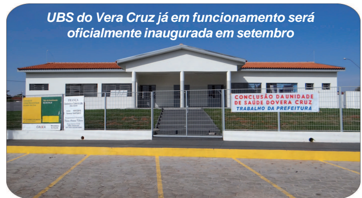
UBS do Vera Cruz já em funcionamento será oficialmente inaugurada em setembro

Quadra da EMEB Fausto dos Santos Rodrigues, no Paraíso