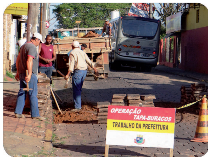
Nivelamento e recuperação de lajotas na Rua Pará