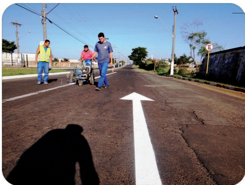
Sinalização de trânsito na Avenida Mário Covas

Seguindo um cronograma de ações, as equipes de manutenção de praças e jardins e roçada de áreas verdes também estão mantendo os serviços essenciais em dias nos bairros e região central.