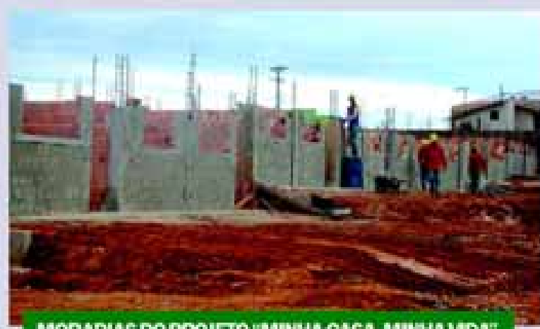
MORADIAS DO PROJETO "MINHA CASA, MINHA VIDA"