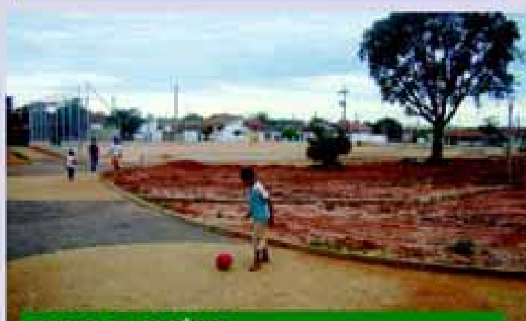
PRAÇA DO MILÊNIO