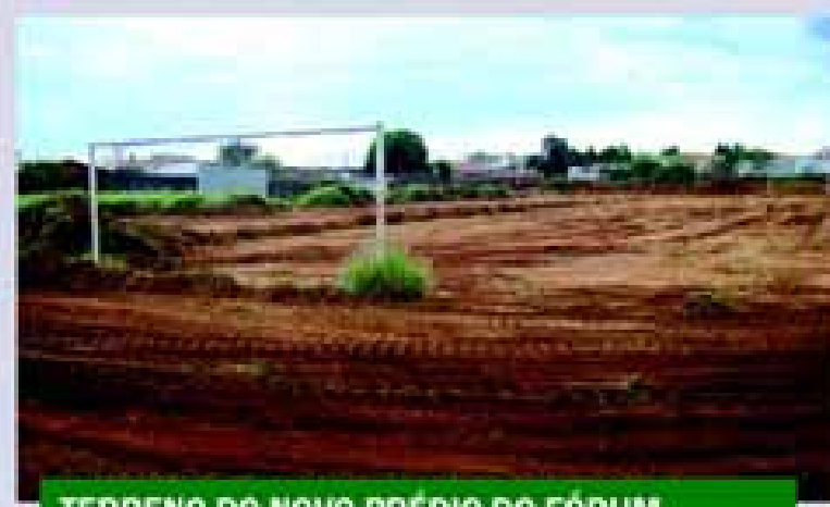
TERRENO DO NOVO PRÉDIO DO FÓRUM

Em breve começa a construção das arquibancadas, palco, camarotes, sanitários, uma obra com uma arquitetura projetada, transformando a cidade em referência na realização de rodeios. A obra é resultado de um convênio de R$ 1.155.709,41, verba aprovada pelo Departamento de Apoio ao Desenvolvimento das Estâncias Turísticas (DADE).