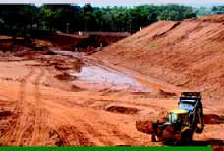
CENTRO DE EVENTOS E RODEIOS

Confira as realizações nas áreas de urban