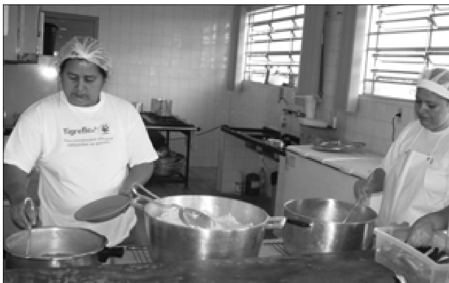
A merenda escolar agora é feita nas próprias escolas

A cozinha piloto fornece os mantimentos, como arroz, feijão, carne, batata, entre outros gêneros alimentícios, e as merendeiras das escolas preparam a alimentação das crianças, proporcionando uma refeição saudável e de qualidade.