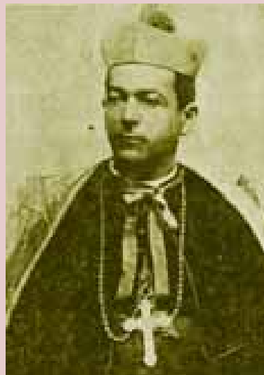
Dom Lúcio, primeiro bispo de Botucatu