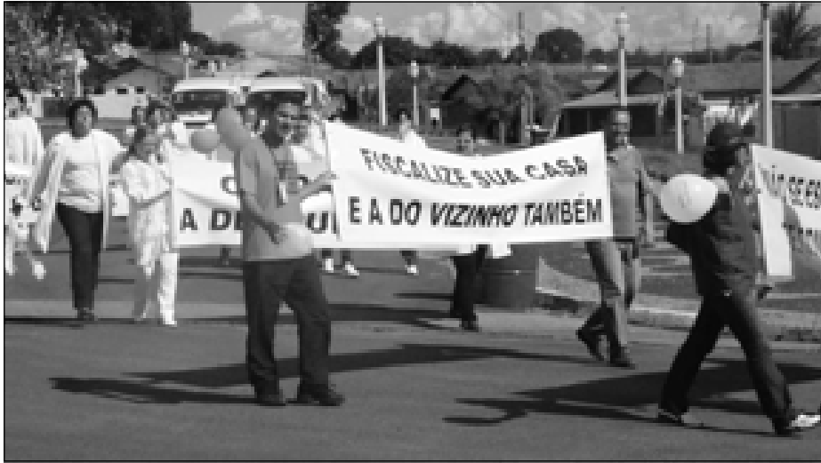
Equipe do PSF “em peso” pronta para orientar os moradores do Duílio Gambini

Os funcionários do PSF Hirata II percorreram os bairros Duílio Gambini, Jardim Santa Mônica e Jardim Presidencial. A manifestação contou com a participa-