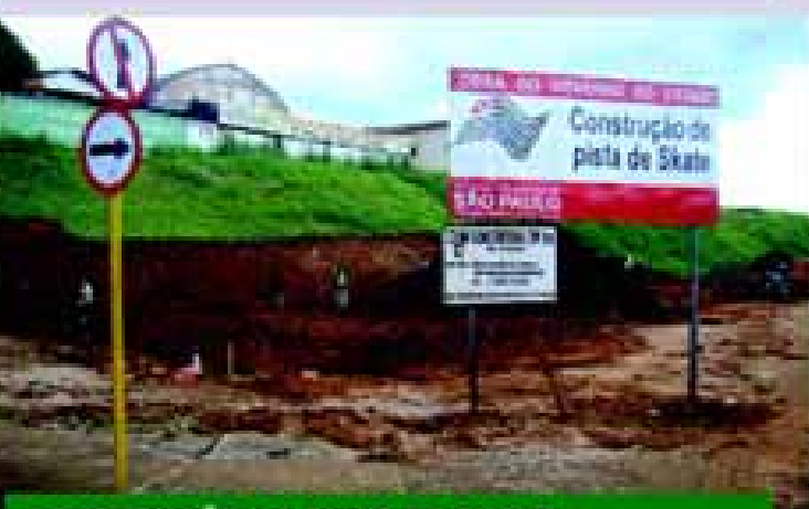
CONSTRUÇÃO DA PISTA DE SKATE