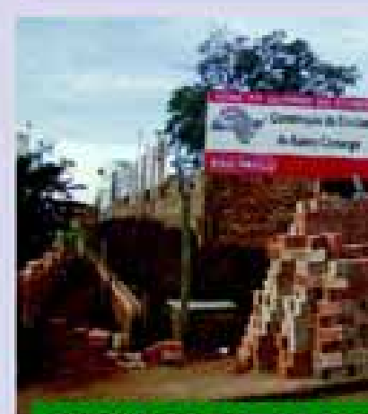
CRECHE DO BAIRRO CAM

A Prefeitura da Estância Turística de Avaré, cumprindo com sua meta de governar para pessoas, está realizando importantes obras e quem ganha é a população, em qualidade de vida. São várias realizações nos setores de urbanismo, habitação, esporte e lazer, educação, esporte e lazer, entre outras, que somam R$ 33.758.794,32.