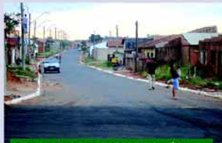
ASFALTO DAS RUAS DO JARDIM PARAÍSO