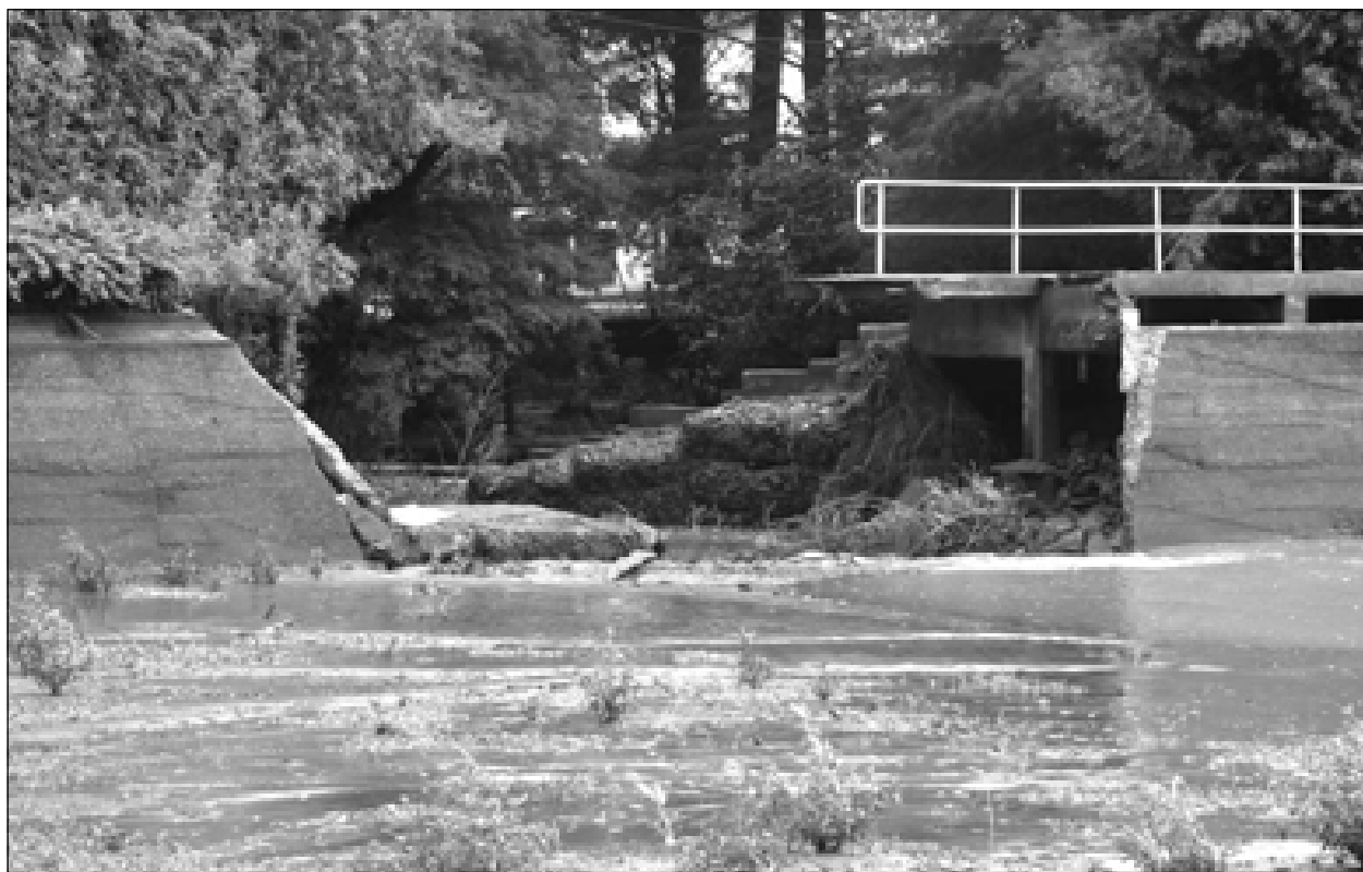
Barragem do Horto destruída pelas chuvas