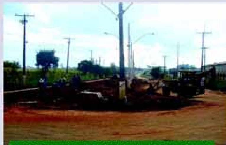
TERRAPLANAGEM DA DONGUINHA MERCADANTE