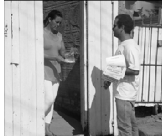
Saúde de Avaré está tentando evitar que surjam novos casos de dengue na cidade

enfermagem e administrativos, a equipe da dengue e, também, os alunos do curso de Fisioterapia.