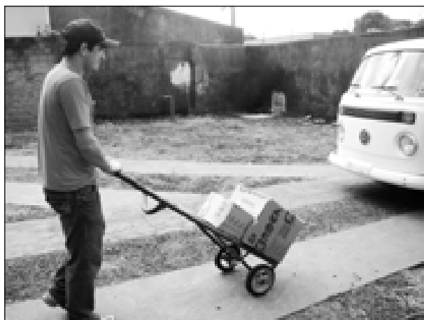
Funcionário leva a cesta até o carro de um servidor municipal

nova cesta básica, além dos produtos da cesta anterior, com as mesmas especificações e qualidades, passa a contar com 1 pacote de carne seca, 1 lata de sardinha, 1 lata de salsicha, além de alguns produtos de higiene pessoal e limpeza, como um tubo de creme dental, uma embalagem de sabonete, uma embalagem plástica de detergente líquido e uma de desinfetante, um pacote de 4 rolos de papel higiênico e um pacote de esponja de aço para limpeza.