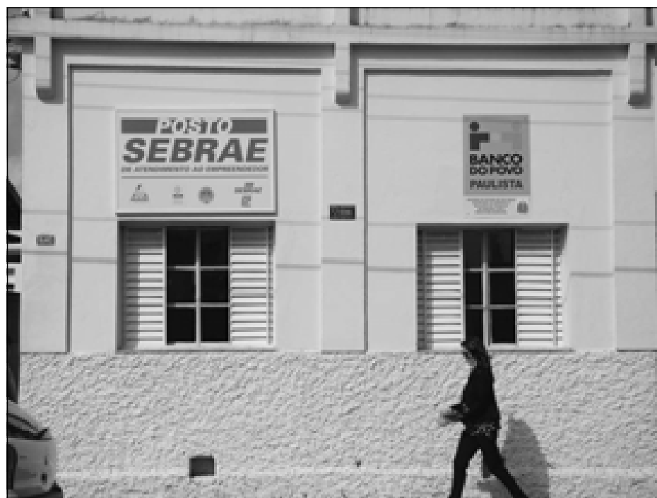
Sede do Banco do Povo Paulista em Avaré

“Dinheiro fácil e barato para quem quer produzir”