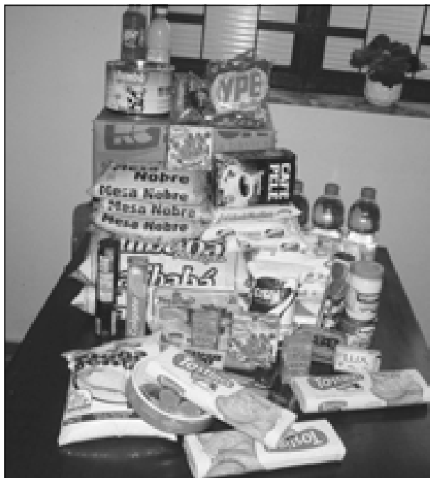
Produtos da nova cesta básica dos servidores municipais

Vale ressaltar que, apesar da queda no preço, a