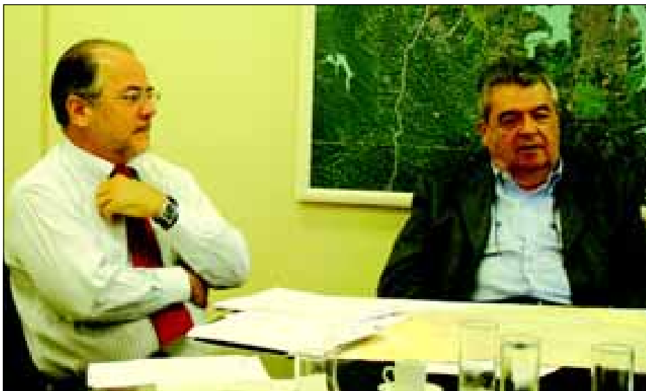
Aleixo e Arce discutem soluções viáveis e urgentes para dirimir o problema das estradas da região

Demonstrando apoio e solidariedade aos seus “vizinhos”, o governo avareense esteve em São Paulo, no último dia 12, participando de uma reunião importante com o secretário de Estado dos Transportes, Mauro Arce, e seu assessor,