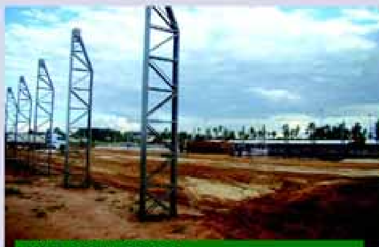
PISTA DE VELOCIDADE