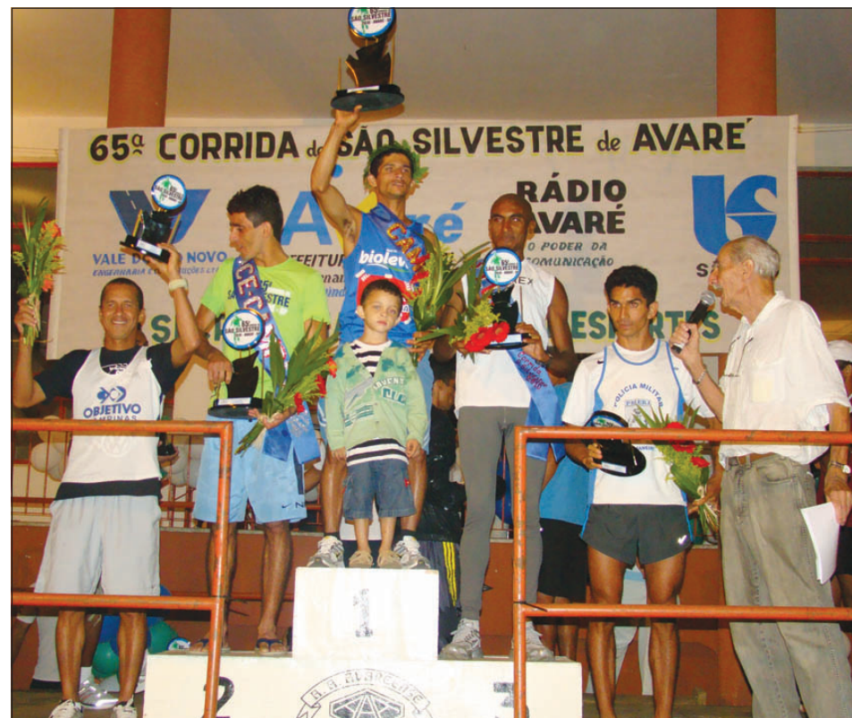
Vencedores da categoria masculina

Já no feminino, as atletas avareenses que