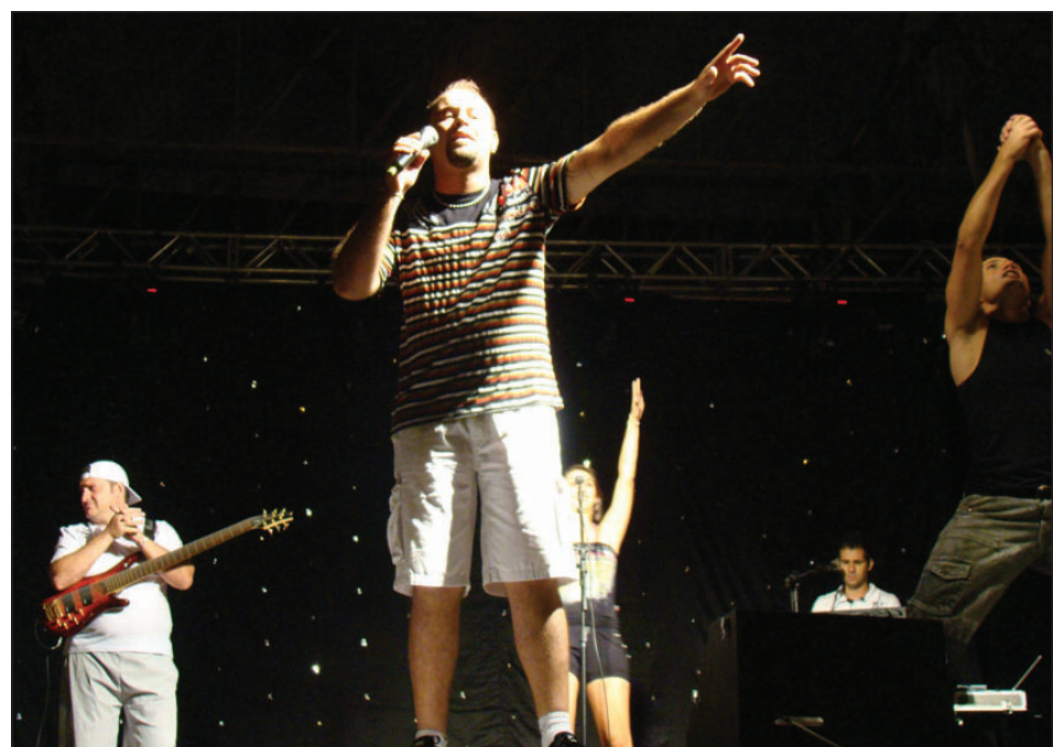
Banda Conexão Pirata

COMBATER A DENGUE É UM DEVER MEU, SEU E DE TODOS.