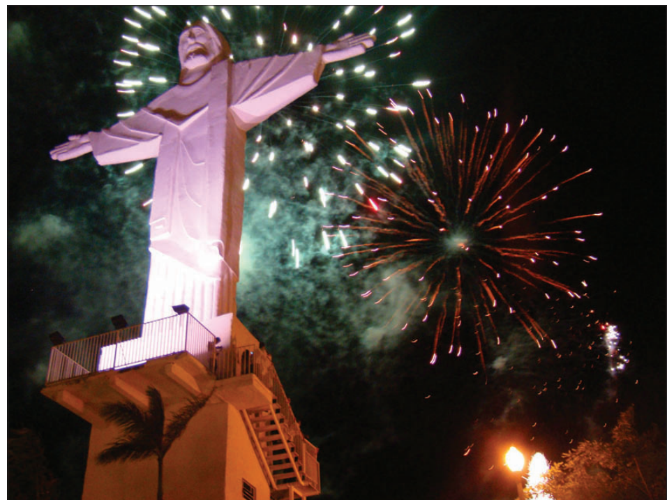
Fogos coloriram o Cristo Redentor