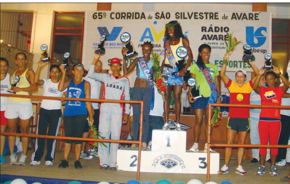
Vencedoras da categoria feminina

Na noite do último dia 31 de dezembro, a Estância Turística de Avaré encerrou o ano esportivo com a realização da Prova Pedestre mais antiga do mundo em cidades do interior, a tradicional Corrida de São Silvestre, que chegou a sua 65ª edição. Foram sete categorias disputadas, batendo recorde de inscrições, dentro de um percurso de 10 mil metros pelas principais ruas centrais da cidade: Adulto Masculino (16 a 39 anos); Adulto Feminino (acima de 16 anos); Veterano A Masculino (40 a 49 anos); Veterano A Feminino (40 a 49 anos); Veterano B Masculino (50 a 59 anos); Veterano B Feminino (acima de 50 anos); e Veterano C Masculino (acima de 60 anos).