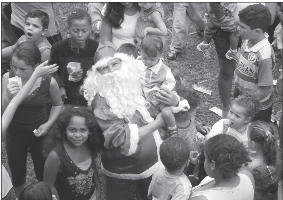
Papai Noel presenteou as crianças