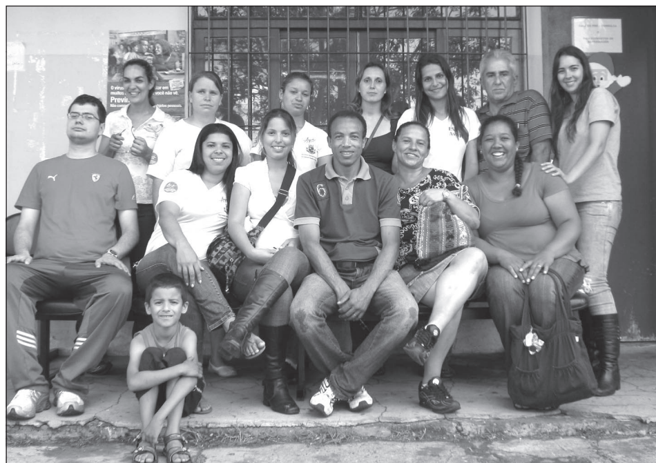
Equipe da Saúde da Família V