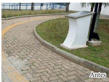
Revitalização do jardim e dos gradis