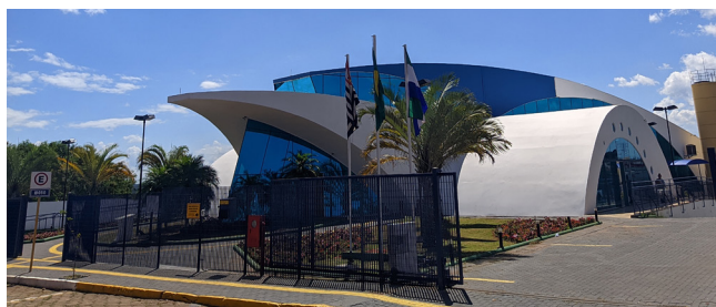
Área externa com pintura revitalizada