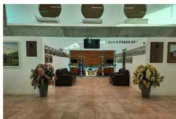
Agora dão mais privacidade ao atendimento ao munícipe