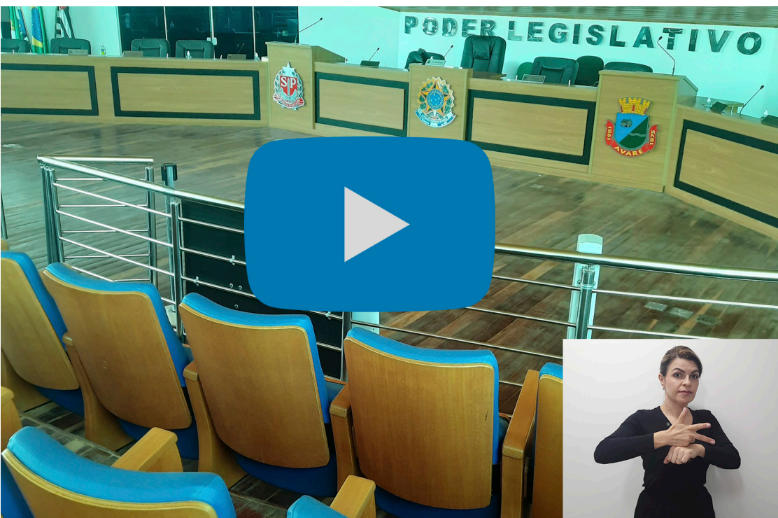
Sessões da Câmara de Vereadores de Avaré, agora, conta com intérprete de LIBRAS