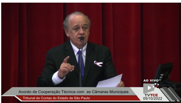
Dimas Ramalho - Presidente do TCE/SP

A Câmara Municipal da Estância Turística de Avaré, no último dia 05 de outubro, assinou, na sede do Tribunal de Contas do Estado de São Paulo, o Termo de Cooperação Técnica entre os órgãos.